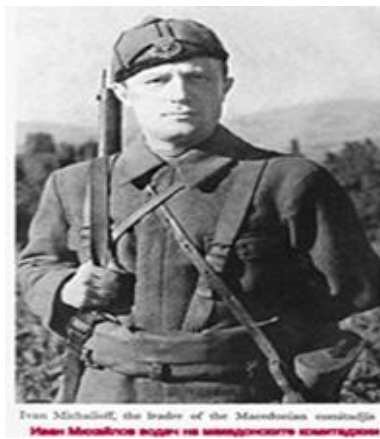
Ivan Michailoff, the leader of the Macedonian committee Иван Михайлов водач на македонските комитети

В следващите месеци водеща фигура в организацията става неговият секретар Иван (Ванчо) Михайлов. Разправата с лявото крило е жестока.