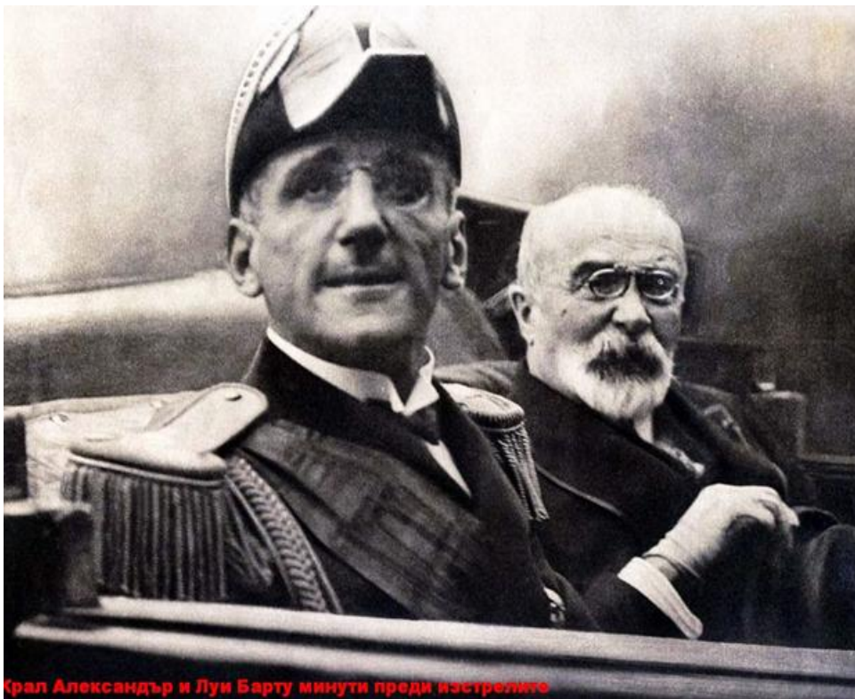
Крал Александър и Луи Барту минути преди изстрелите

В последния момент основната кола от кортежа е сменена. Вместо предвидената бронирана лимузина е наета друга кола. Единственото ѝ предимство, което всъщност ще се окаже фатален недостатък, е, че част от гюрука ѝ може да се сваля. Идеята е всеки от многохилядното множество да види височайшия гост, а и десетките фоторепортери и кинооператорите да го заснемат. Все с тая цел дори страничните стъкла са свалени.